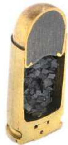
Una cartuccia metallica sezionata. Si nota all'interno la polvere da sparo e la palla blindata con il nucleo di piombo

Solo per citare i più diffusi, nelle armi dotate di otturatore scorrevole, si impiegano bossoli che hanno una scanalatura ricavata lungo il diametro nel quale va ad agganciarsi l'estrattore. Altre tipologie di cartucce, tipiche dei revolver, hanno un orlo sporgente che può essere impegnato dalla stella estratrice favorendo l'espulsione dei bossoli dal tamburo.