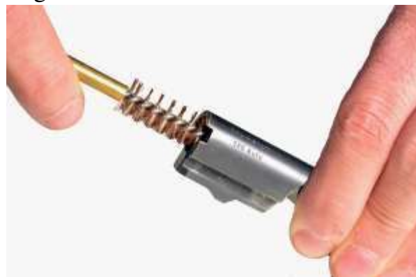
Lo scovolo dovrebbe essere inserito dalla camera di cartuccia

Prima dello smontaggio ordinario, si deve effettuare la sequenza di accertamento dello stato dell'arma (vedi sequenza su parte 1ª del manuale); in seguito si provvederà a rimuovere i residui dello sparo con appositi spazzolini e sgrassare le parti interne utilizzando un solvente generico. L'interno della canna dovrà essere pulito, con energiche e ripetute passate, utilizzando uno scovolino in rame o bronzo. Ne esistono di varie lunghezze a seconda della lunghezza della canna. Il revolver necessita della pulizia delle camere del tamburo, specialmente nella parte anteriore dove si depositano i residui della vaporizzazione del materiale di cui sono composte le palle utilizzate.