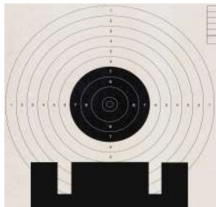
I congegni di mira posizionati “a zona”

Nel tiro sportivo di precisione, si effettua normalmente il tiro cosiddetto “a zona”, ponendo il mirino e la tacca distante dal centro del bersaglio, lasciando una porzione