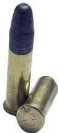
Cartucce calibro .22LR, notare l'impronta del percussore sul bordo del fondello

Al momento dell'esplosione si raggiungono temperature che variano tra i 1500 e i 2200 gradi centigradi.