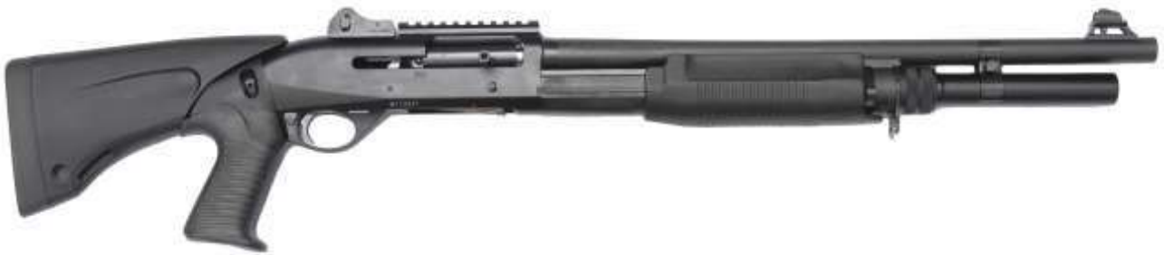
Un moderno fucile semiautomatico calibro 12 in configurazione tattica

In ultimo i fucili semiautomatici , che impiegano vari sistemi di funzionamento. I modelli più diffusi si avvalgono di otturatori a testine rotanti, sistemi a recupero di gas e principi inerziali.