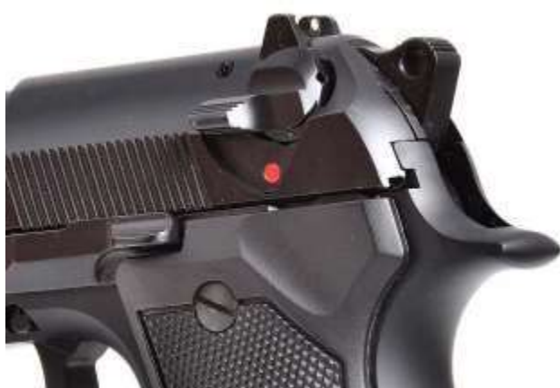
Pistola Beretta serie 92. Si nota la sicura manuale che, oltre ad interrompere la catena di scatto, ha la funzione "abbatticane"

Le sicure manuali si inseriscono tramite leve ergonomiche applicate sulla struttura dell'arma. Quando attivate agiscono sui meccanismi interni in vari modi. Possono interrompere la catena di scatto e/o, in particolari modelli, evitare di azionare manualmente il cane tramite la sicura detta " abbatticane ". Tale congegno provvede a sottrarre il percussore all'azione del cane mentre questo torna in posizione di riposo in piena sicurezza.