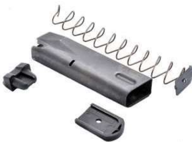
Un serbatoio completamente smontato

Il serbatoio può essere monofilare ( single stack ) o bifilare ( double stack ) ed essere provvisto di fori sulla costolatura posteriore per il controllo delle cartucce in esso contenute.