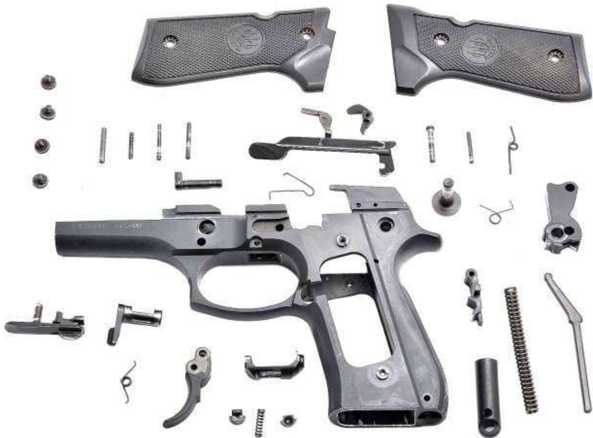
Nella foto lo smontaggio completo del fusto di una pistola Beretta mod. 92/98 FS

In base ai modelli, nel fusto trovano posto la sicura manuale, la leva arresto carrello, anche con funzione di chiavistello di smontaggio, il pulsante sgancio serbatoio, i vari componenti del sistema di scatto, l'espulsore e le guance.