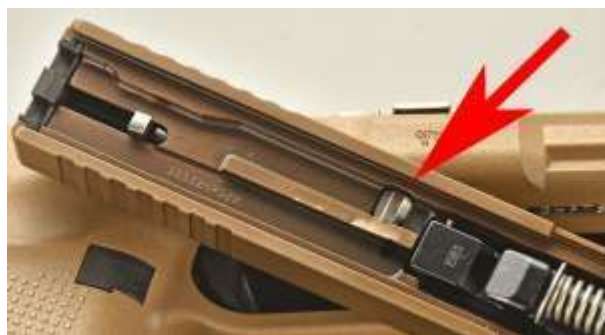
La freccia indica la provvidenziale sicura automatica al percussore collocata all'interno del carrello

Le sicure automatiche sono, invece, quelle sempre attive. Esse si disattivano solo al momento dello sparo volontario dell'utilizzatore.