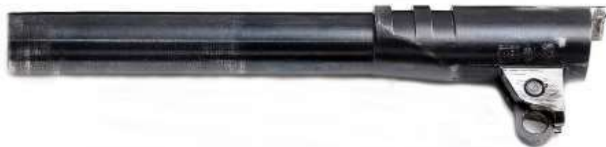
La canna di una pistola Colt mod 1911, dotata di biella e tenoni

Il sistema di chiusura Colt/Browning a corto rinculo di canna si avvale, per il funzionamento, dei tenoni ricavati sulla canna in prossimità della camera di cartuccia. I tenoni combaciano con rispettivi incavi praticati sul cielo del carrello. La canna è provvista di uno zoccolo al quale è fulcrata una piccola biella, a sua volta trattenuta al fusto tramite il traversino della leva arresto carrello (hold open) .