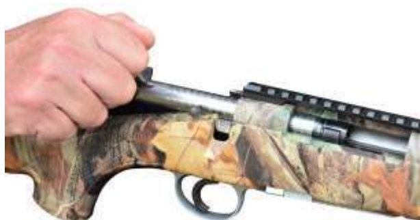
L'otturatore in fase di apertura

È un'arma a ripetizione "ordinaria" ovvero si serve dell'azione del tiratore per il caricamento e sparo in successione delle cartucce. Si avvale di un sistema consistente in un otturatore al cui interno è alloggiato il percussore e l'estrattore. L'otturatore girevole, scorrevole solitamente è provvisto di alette a piani elicoidali che permettono la rotazione dell'otturatore stesso, consentendo la graduale apertura della culatta e l'estrazione graduale del bossolo. L'azionamento dell'otturatore permette di armare il percussore. Per facilitare l'azionamento, l'otturatore è provvisto di un'appendice detta "manubrio". Le carabine possono avere un serbatoio amovibile.