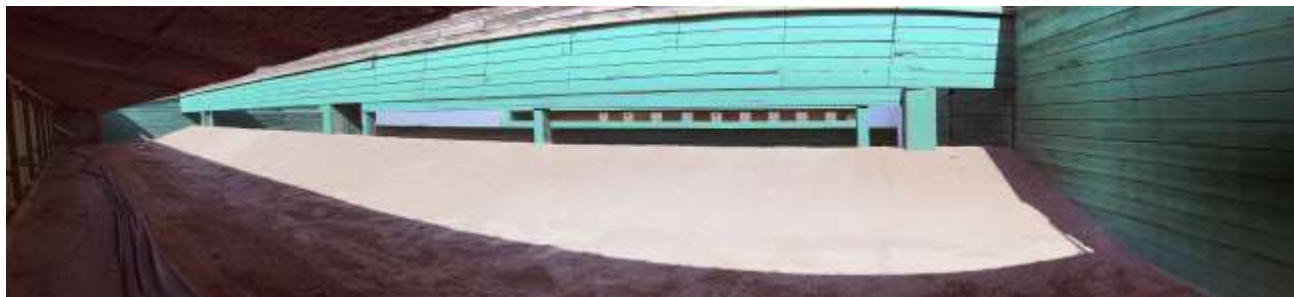
Un settore di tiro a 25 metri. Si noti in alto la struttura del diaframma verde. Sul fondo si intravedono i bersagli.

Un poligono di tiro chiuso a cielo aperto, è una struttura atta a contenere e impedire la fuoriuscita delle palle (proiettili) sparate durante gli allenamenti.