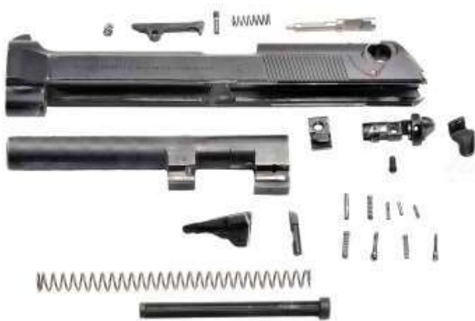
Nella foto lo smontaggio completo di un carrello della pistola Beretta mod.92/98

Sulla sommità del carrello trovano posto i congegni di mira: anteriormente il mirino, posteriormente la tacca di mira. Ai due lati, per favorirne l’arretramento, sono ricavati posteriormente e in alcuni modelli anche anteriormente, gli intagli di presa.