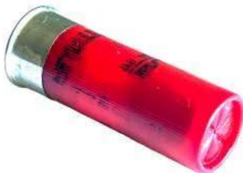
Cartuccia calibro 12. Anteriormente si nota la chiusura "stellare"

In questo caso il calibro indica il numero di palle - di eguale peso - che si possono ricavare da una libbra inglese (gr. 453,6) di piombo. Quindi, un fucile da caccia cal 12, (12 palle) ha un calibro in millimetri più grande del calibro 20 (20 palle).