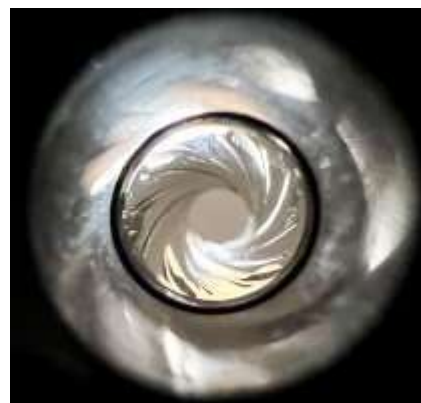
La rigatura di una canna

È un tubo metallico a pareti resistenti di conveniente diametro interno (calibro) e lunghezza. La parte posteriore e detta “vivo di culatta”, quella anteriore “vivo di volata” e il suo orificio è detto “bocca”. La canna è composta dalle seguenti parti: la camera di cartuccia, da un raccordo troncoconico e dall’anima (la parete interna) che può essere liscia o rigata.