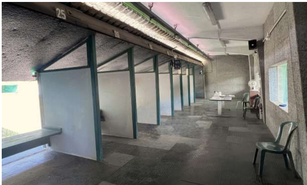
L’interno di un settore di tiro. si notano i setti separatori in acciaio balistico. Pareti e pavimenti sono rivestiti di materiali fonoassorbenti e anti rimbalzo.

È presente un “ pancone ” sul quale è possibile collocare l’attrezzatura per il tiro.