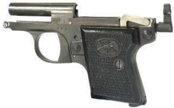
La pistola Bernardelli, mod. Baby, dotata di chiusura a massa in smontaggio ordinario. Si nota la canna ancorata al fusto

Dopo questa breve corsa la biella costringe la canna a bloccarsi e ruotare verso il basso, disimpegnando il carrello dai tenoni in modo che esso possa continuare la sua corsa retrograda. In questa fase, il carrello provvede (tramite l'estrattore) a estrarre il bossolo vuoto, armare il cane e comprimere la molla di recupero. A fine corsa la molla di recupero si distende e riporta il carrello otturatore in chiusura.