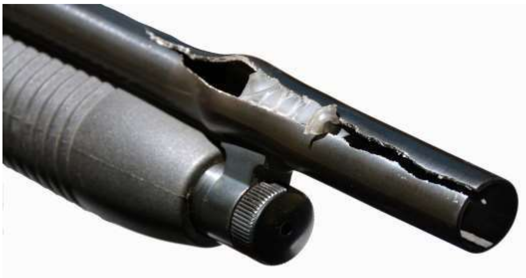
Fucile calibro 12. Il picco delle pressioni, dovuto a ostruzione, ha causato rigonfiamento e fessurazione della canna in prossimità della volata

Le alte pressioni, generate dalle moderne cartucce, non si adattano ad armi antiche o mal conservate. Identica attenzione va riposta nel controllo dell'interno delle canne in quanto anche una lieve ostruzione (foglie, sporcizia, pezzuole utilizzate per pulizia) può provocare danni molto gravi, sia al tiratore, sia a persone a lui vicine.