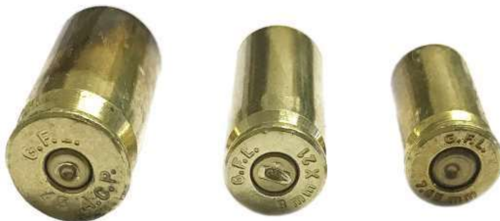
Foto di alcuni bossoli sparati che recano sulla capsula l'impronta del percussore. Si nota nel fondello l'indicazione del calibro e della fabbrica

Inizialmente, per la carica di lancio si utilizzava la cosiddetta " polvere nera ", una miscela ternaria di carbone, zolfo e salnitro. Non priva di difetti, la polvere nera a fine anni 800 fu gradualmente sostituita dalla polvere da sparo moderna, detta " infume " a causa del minor fumo che genera durante la combustione.